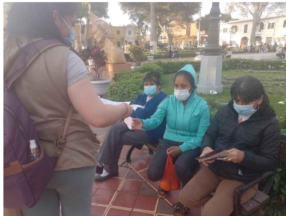
PIBI en la Plaza San Martín - calles de Lima